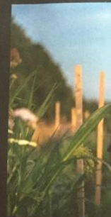
'WAT IK GRAAG ZOU WILLEN, IS MIJN LIEFDE VOOR LICHT EN BEZIELDE MENSEN COMBINEREN'