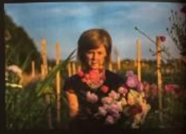
'WAT IK GRAAG ZOU WILLEN, IS MIJN LIEFDE VOOR LICHT EN BEZIELDE MENSEN COMBINEREN'