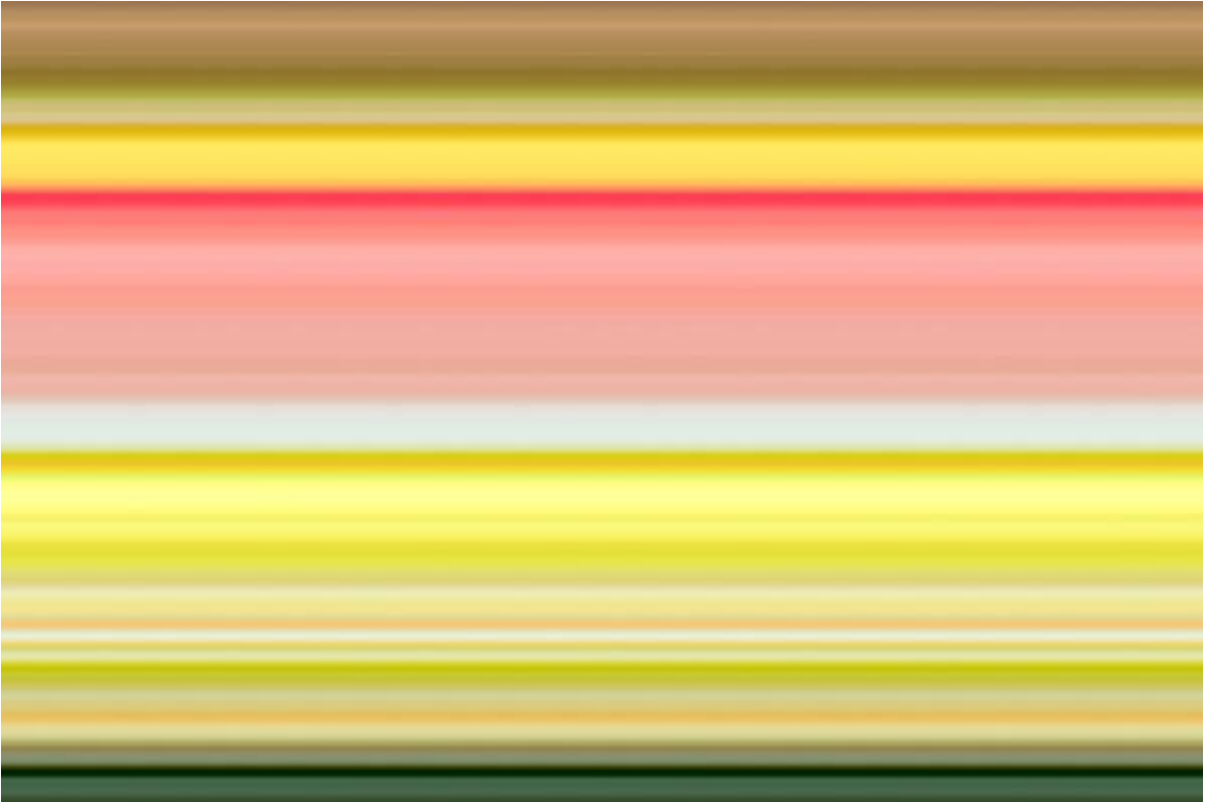
Schrijven met licht (2)